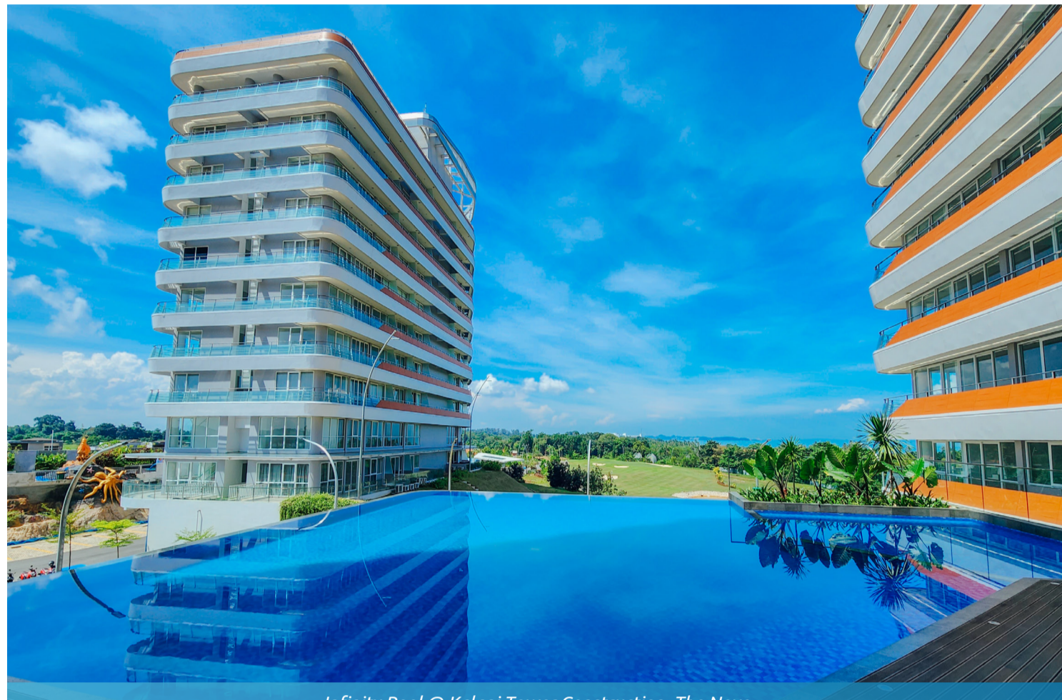
Infinity Pool @ Kalani Tower Construction, The Nove

Nuvasa Bay's flagship product and emblem of luxury have reached monumental milestones. As of November, Kalani Tower stands tall and magnificent, with construction now 100% completed. This architectural marvel not only graces the skyline of Nuvasa Bay but also offers an unparalleled living experience within its grandeur.