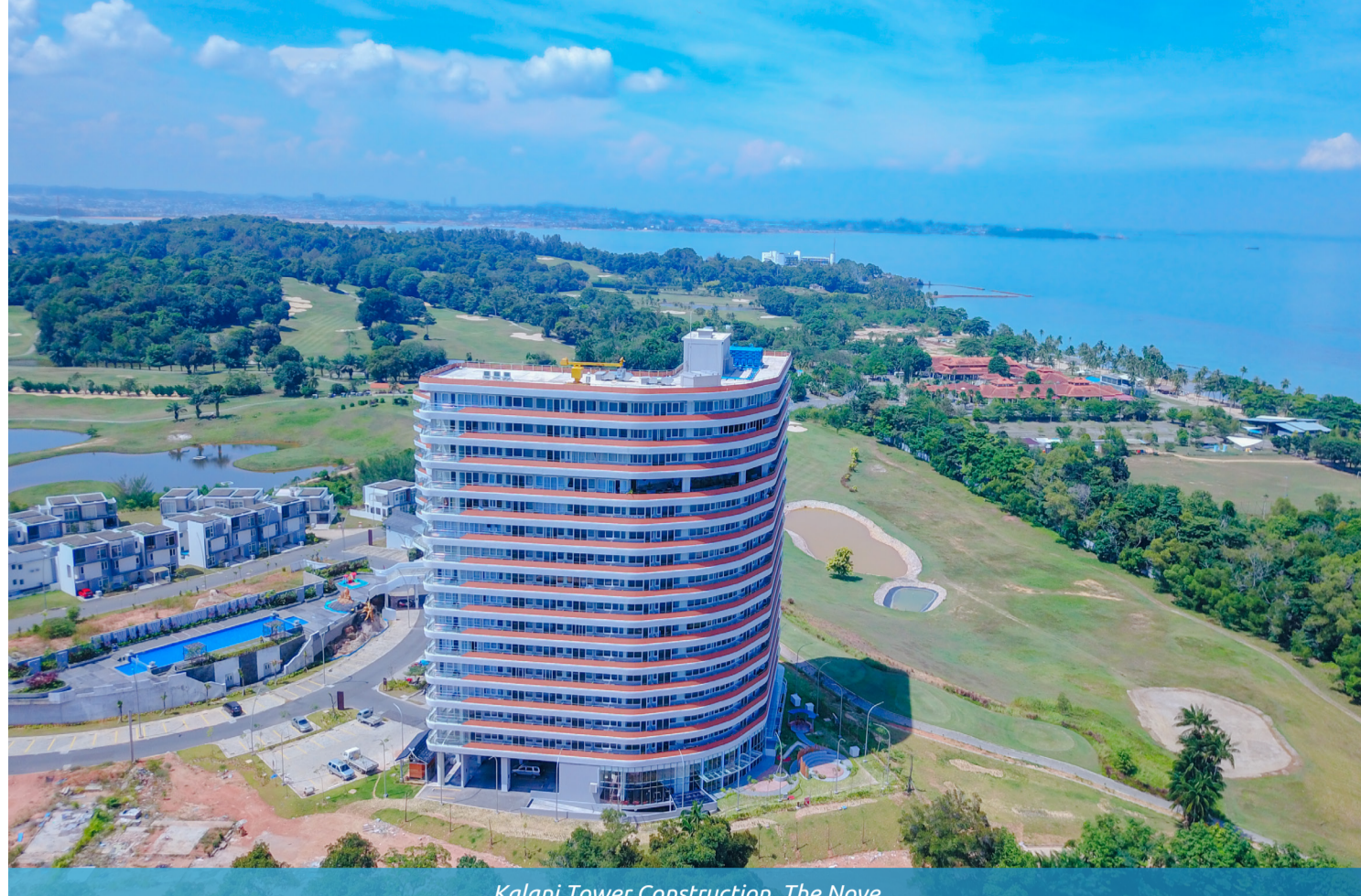
Kalani Tower Construction, The Nove

Produk unggulan dan lambang kemewahan di Nuvasa Bay, telah mencapai pencapaian yang monumental. Pada bulan November, tower Kalani telah berdiri tegak dan megah, dengan konstruksi yang kini telah selesai 100%. Keajaiban arsitektur ini tidak hanya menghiasi cakrawala Nuvasa Bay namun juga menawarkan pengalaman hidup yang tak tertandingi di dalam kemegahannya.