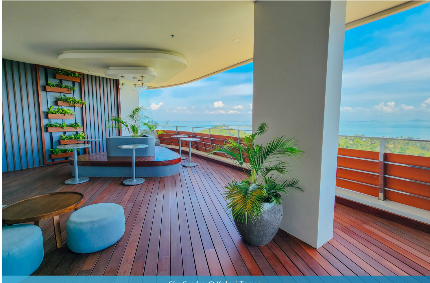
Sky Garden @ Kalani Tower

As the sun dips below the horizon, immerse yourself in the allure of the Infinity pool at the Kalani tower. The Infinity pool is your private oasis where time seems to stand still. Unwind, rejuvenate, and let the tranquility of the water transport you to a world of serenity.