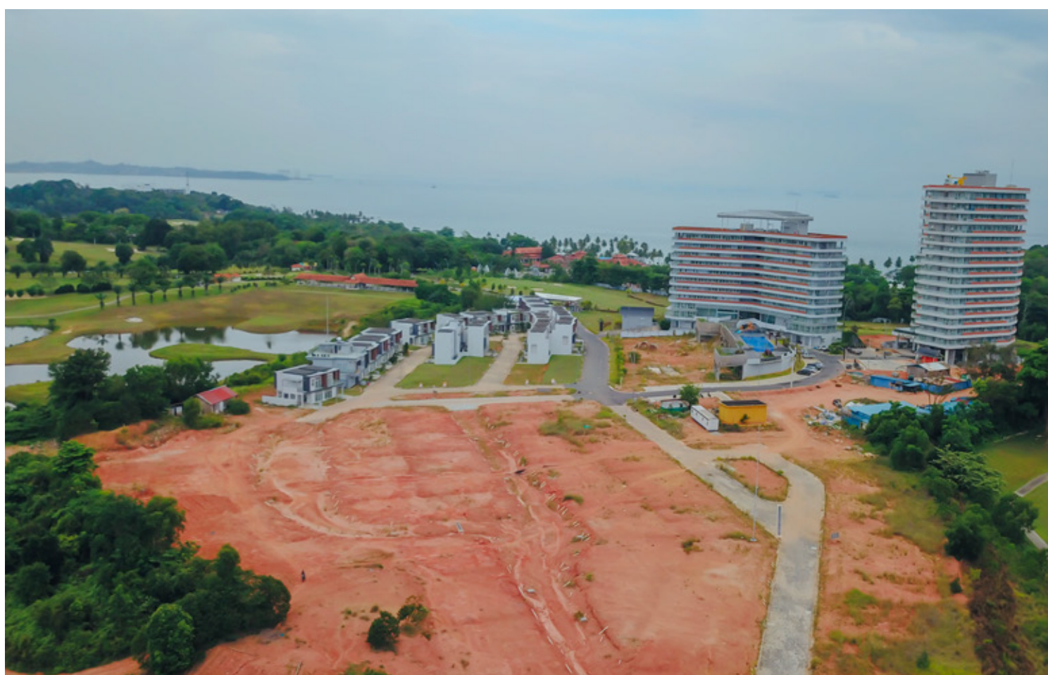
Construction of Landed House phase 2

Kalani tower @ The Nove is equipped with an infinity pool facility that is currently entering the finishing concrete pattern which has reached 85 percent of construction progress.