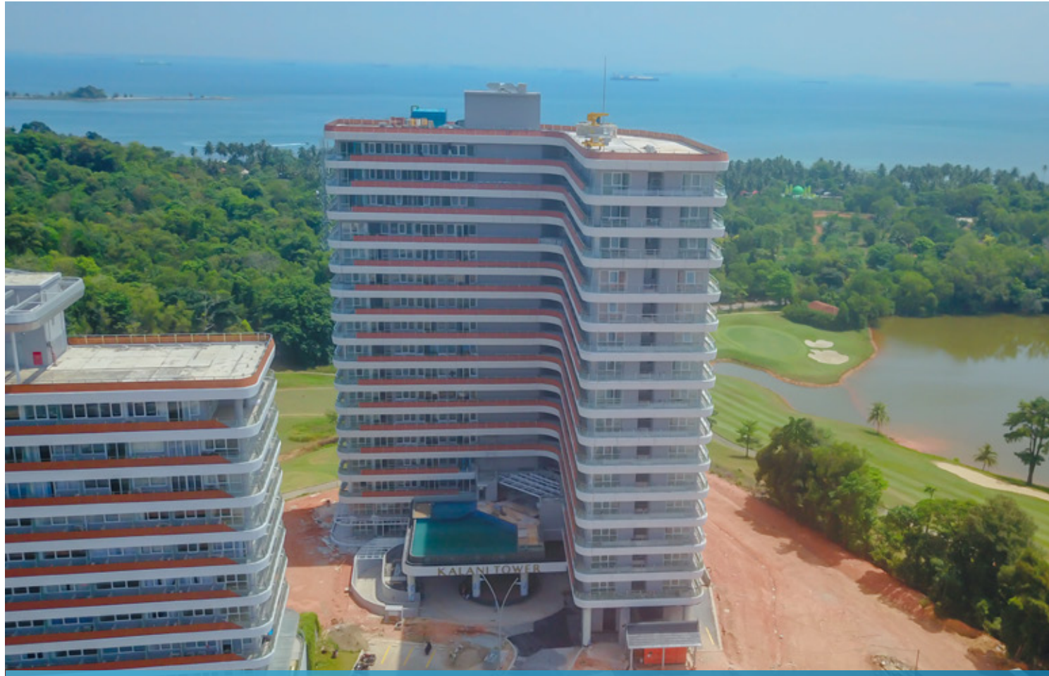
Kalani Tower Construction, The Nove

Apartemen Kalani merupakan salah satu produk unggulan yang berada di dalam kawasan residensial The Nove, Nuvasa Bay Batam. Saat ini, apartemen tersebut sudah memasuki pekerjaan pengecatan, pembersihan unit dan perbaikan defect yang telah mencapai progres 98 persen. Selanjutnya, pekerjaan fasad telah memasuki pemasangan railing batas unit dan sera wood yang telah mencapai 95 persen. Apartemen ini juga telah memasuki tahap pemasangan pintu dan jendela aluminium yang telah mencapai 97 persen.