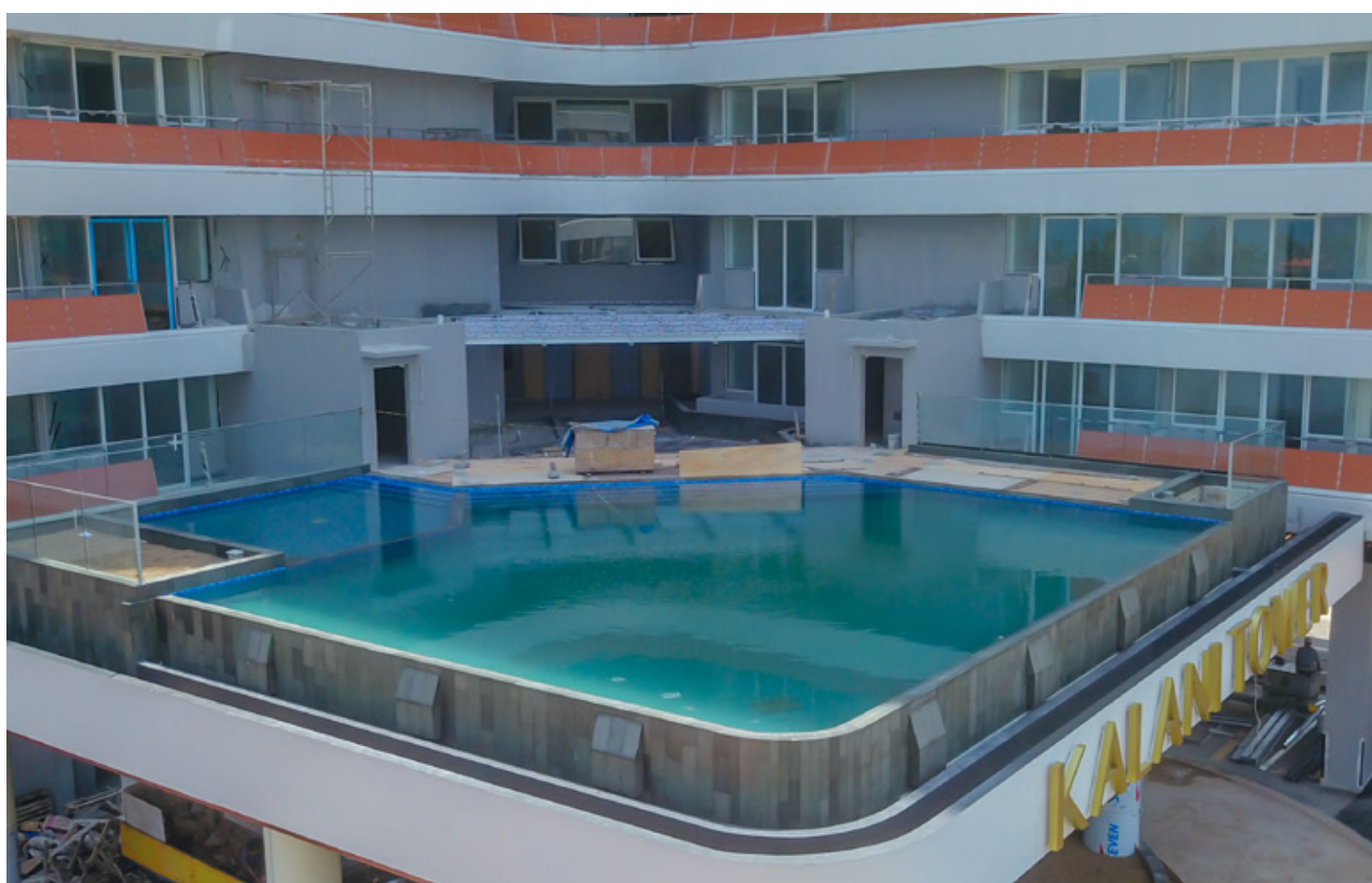
Infinity Pool @ Kalani Tower Construction, The Nove

One of our flagship products in The Nove area is the Kalani Apartment. Currently, the apartment is undergoing wall painting, unit cleaning and defect repair work which has reached 98 percent of progress. Furthermore, the facade work has included the installation of unit boundary railings and sera wood which has reached 95 percent of progress. Followed by the installation of aluminum doors and windows which have reached 97 percent of progress.