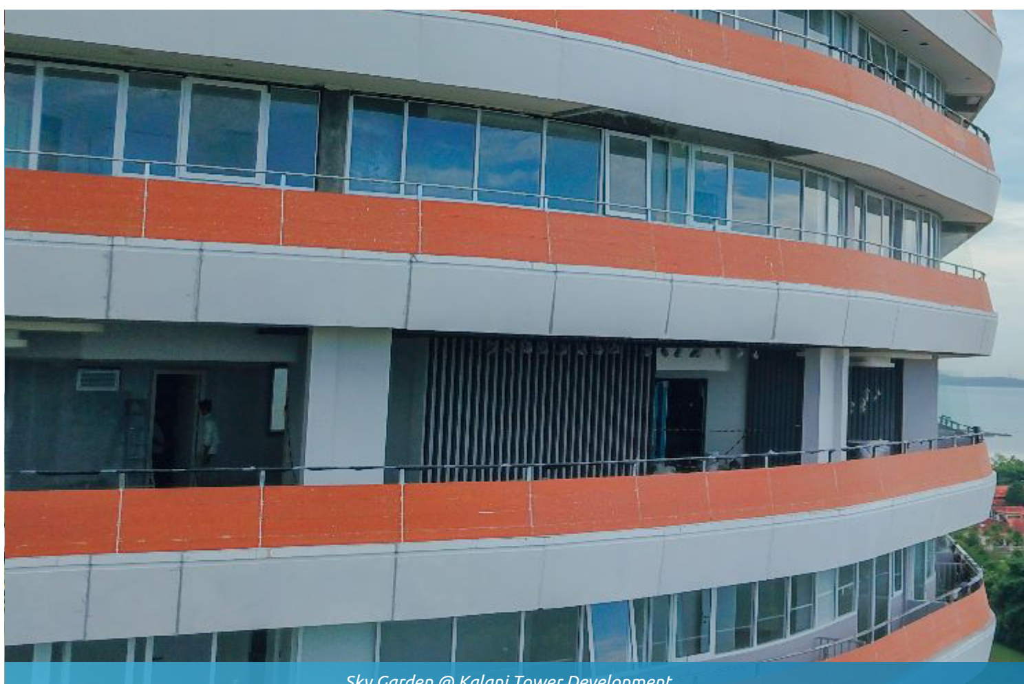
Sky Garden @ Kalani Tower Development

Phase two of The Nove Residence is currently entering the construction of road paving and canal construction, with work progress reaching 100 percent. Furthermore, Public Street Lighting & FO (Fiber Optic) work will be carried out which has reached 90 percent of progress.